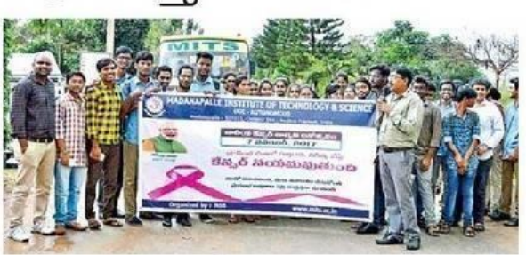
అవగాహన ర్యాలీ నిర్వహిస్తున్న మిట్స్ విద్యార్థులు

పరిణమిస్తాయన్నారు. ఆహారపు అలవాట్లు సక్రమంగా ఉండాలని సూచించారు. జబ్బులను తొలిదశలోనే గుర్తిస్తే రాజు, అధ్యాపకులు పాల్గొన్నారు.