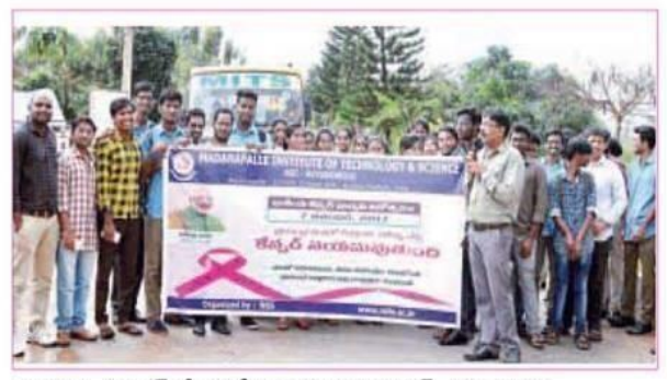
అంగక్కు సర్కిల్ల్ ర్యాలీ నిర్వహిస్తున్న మిట్స్ విద్యార్థులు

మదనపల్లె, నవంబర్ 7: అంగళ్ళు త్సవం పురస్కరించుకుని మంగళవారం సమీపంలోని మిట్స్ ఇంజనీరింగ్ కళా మిట్స్ ఎన్ఎస్ఎస్ వాలంటీర్లచే క్యాన్సర్